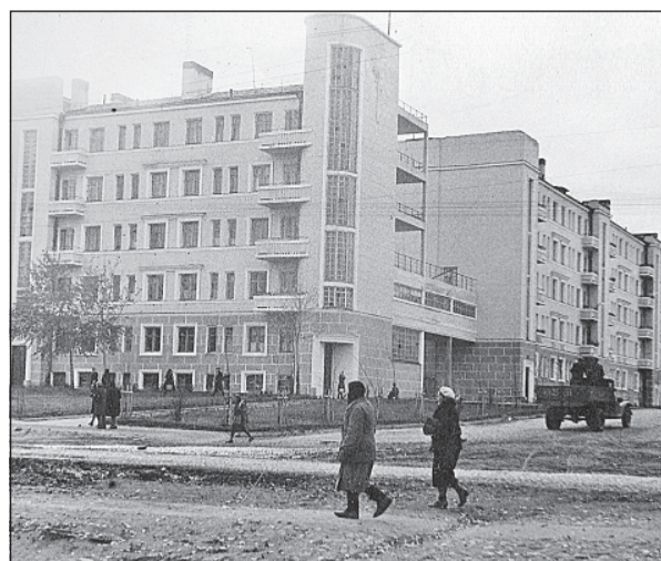
Дом ИТР. 30-е годы XX века